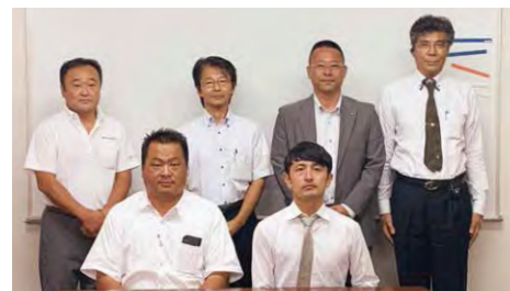
2019年度 第3回中国ブロック地区部長会議 (9月7日)