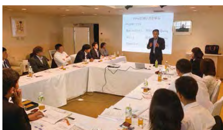
2019年度 四国ブロック勉強会 (10月26日)