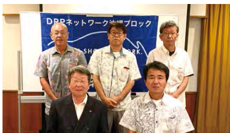
2019年度 沖縄ブロック勉強会 (10月5日)