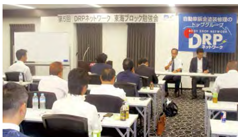
2019年度 東海ブロック勉強会 (9月20日)