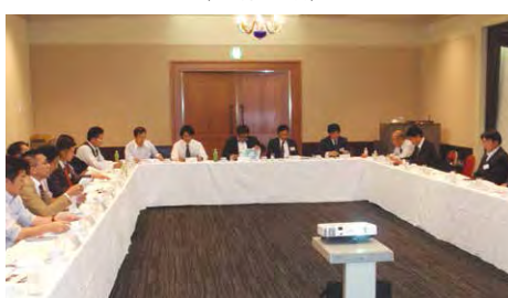
2019年度 北海道ブロック勉強会 (10月11日)