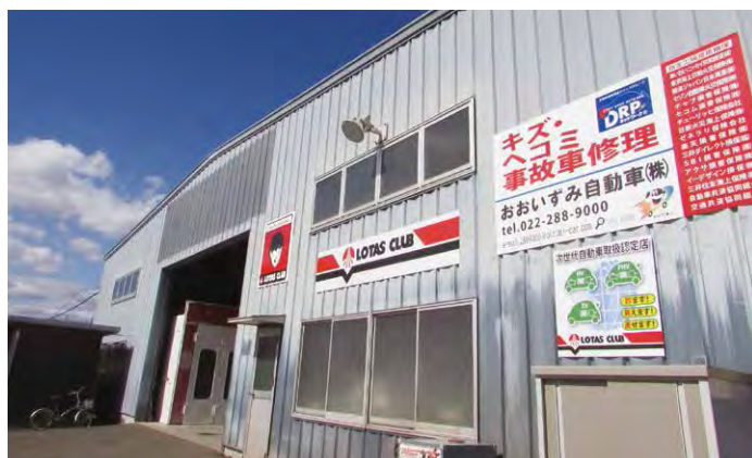
おおいずみ自動車(株) 宮城県仙台市若林区