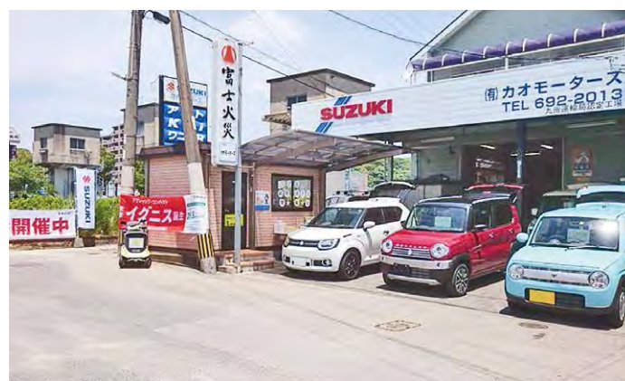
(有)カオモータース 福岡県北九州市八幡西区則松