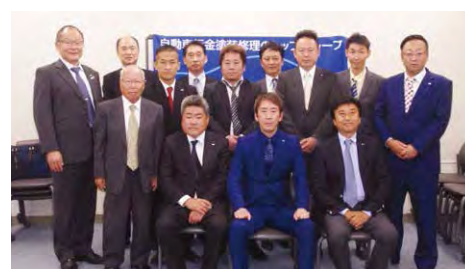
2019年度 第4回首都圏甲信越ブロック地区部長会議 (10月26日)