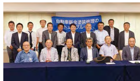
2019年度 第3回九州ブロック地区部長会議 (8月24日)