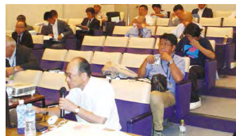
2019年度 東北ブロック勉強会 (10月5日)