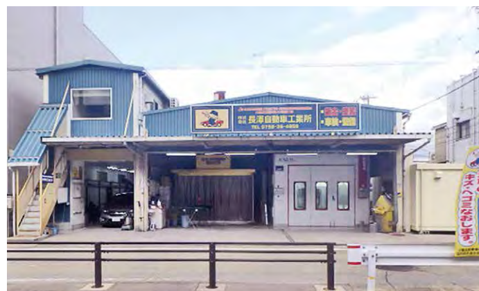
(株)長澤自動車工業所 兵庫県西宮市今津山中町