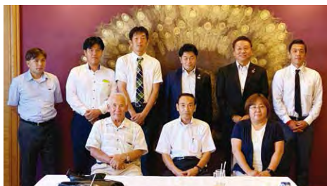
2019年度 第3回四国ブロック会議 (9月6日)