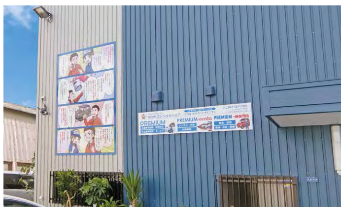
(株)エンジェルシェア PREMIUM 福岡県糟屋郡志免町南里