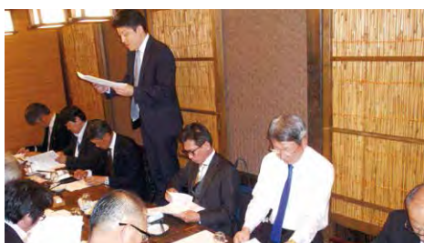
2019年度 賛助会社協力会総会 (10月10日)