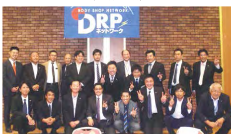
2019年度 北海道ブロックお客様感謝の夕べ (10月11日)