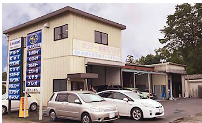
(有)平野オートボディー 東京都八王子市元八王子町