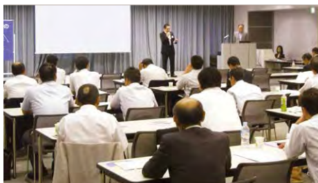
2019年度 関西ブロック勉強会 (9月7日)