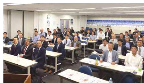
2019年度 九州ブロック勉強会 (10月11日)