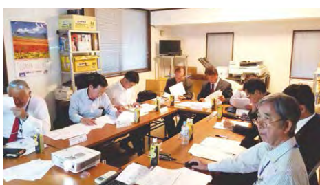
2019年度 第3回コグニ会会長見積勉強会 (10月25日)