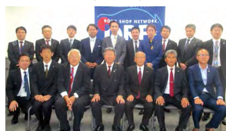
2019年度 第4回全国ブロック長会議 (10月19日)