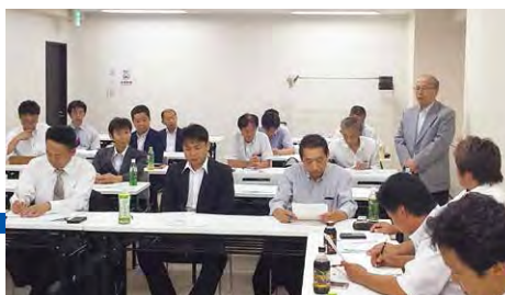
2019年度 第3回首都圏甲信越ブロック地区部長会議 (7月6日)