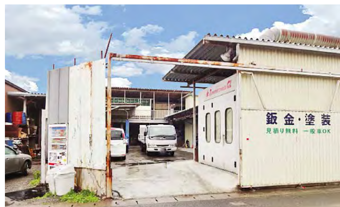
(株)ユースフル 東京都板橋区高島平