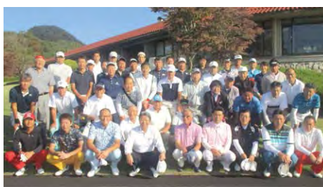
2019年度 DRPネットワーク親睦ゴルフコンペ (10月10日)